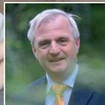
Accountants willen grotere rol in maatschappelijk debat