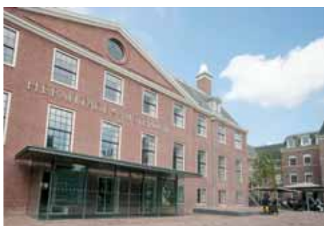
Hermitage Amsterdam voorzien van motorsloten en draaideurautomaten

Freke Inbraakbeveiliging BV Voorstraat 38-40 te Katwijk Tel.: 071 - 401 33 41 info@freke.nl www.freke.nl