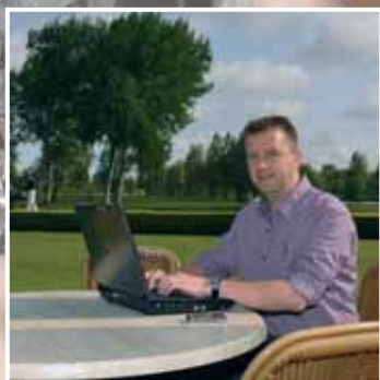
GMSoft maakt tijd voor de toekomst