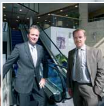
Maatschappelijk Verantwoord Ondernemen