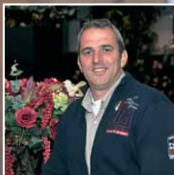
"Betrokkenheid is het sleutelwoord"